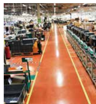
頻繁にレイアウト変更しない 区画ライン

注意：2～3ヶ月以上貼り置きされた場合ははがす時に糊残りが発生しやすくなります。