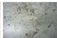
床にこびりついたガムや黒ずみ汚れ落とし