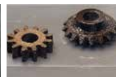
油やグリースで汚れた工具や部品の洗浄