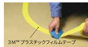
3M™ プラスチックフィルムテープ