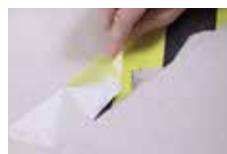
接着剤やラインテープのり残り除去