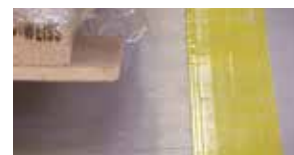
積載パレットがこすれても、テープはめくれにくい