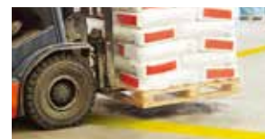
フォークリフトが通行しても切れにくい